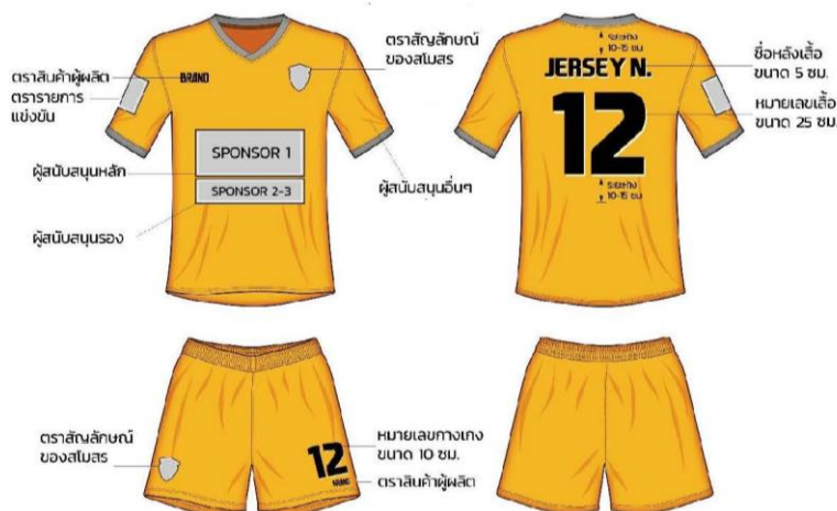
ตัวอย่างการจัดวางตราสัญลักษณ์ แบบอักษรชื่อหลังเสื้อ และหมายเลขชุดแข่งขัน

การโฆษณาบนเสื้อสโมสร ฝ่ายจัดการแข่งขัน อนุญาตให้สโมสรมีการติดโลโก้ ผู้สนับสนุนบนเสื้อแข่งขันได้ โดยทางฝ่ายจัดการแข่งขัน ไม่อนุญาตให้มีการโฆษณาบุหรี การพนันทุกชนิด เครื่องดื่มแอลกอฮอล์ และชื่อบุคคล ลงบนชุดแข่งขัน หากตรวจสอบพบฝ่ายจัดการแข่งขันขอสงวนสิทธิ์ในการแจ้งเปลี่ยนชุดแข่งขันทันที หากมีข้อสงสัยในการติดโฆษณาลงบนชุดแข่งขัน สามารถสอบถามได้ที่ฝ่ายจัดการแข่งขัน